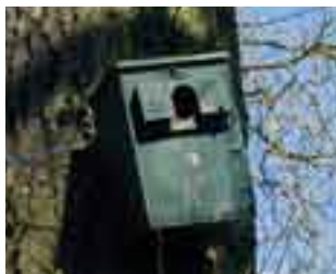
Nichoir à mésange

Les oiseaux comme les mésanges nichent dans les cavités des vieux arbres. Pour les attirer dans le jardin, accrocher un nichoir avant mars. Le suspendre à un arbre ou le long d'un mur exposé au sud-est.