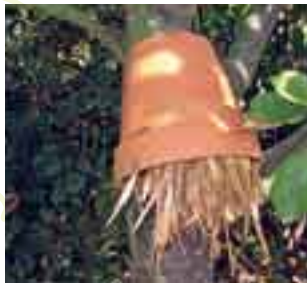
Abri à perce-oreille

→ Glisser des fagots de bois et de tiges creuses dans les haies pour abriter les hérissons, les rouges-gorges et les insectes parasites des pucerons.